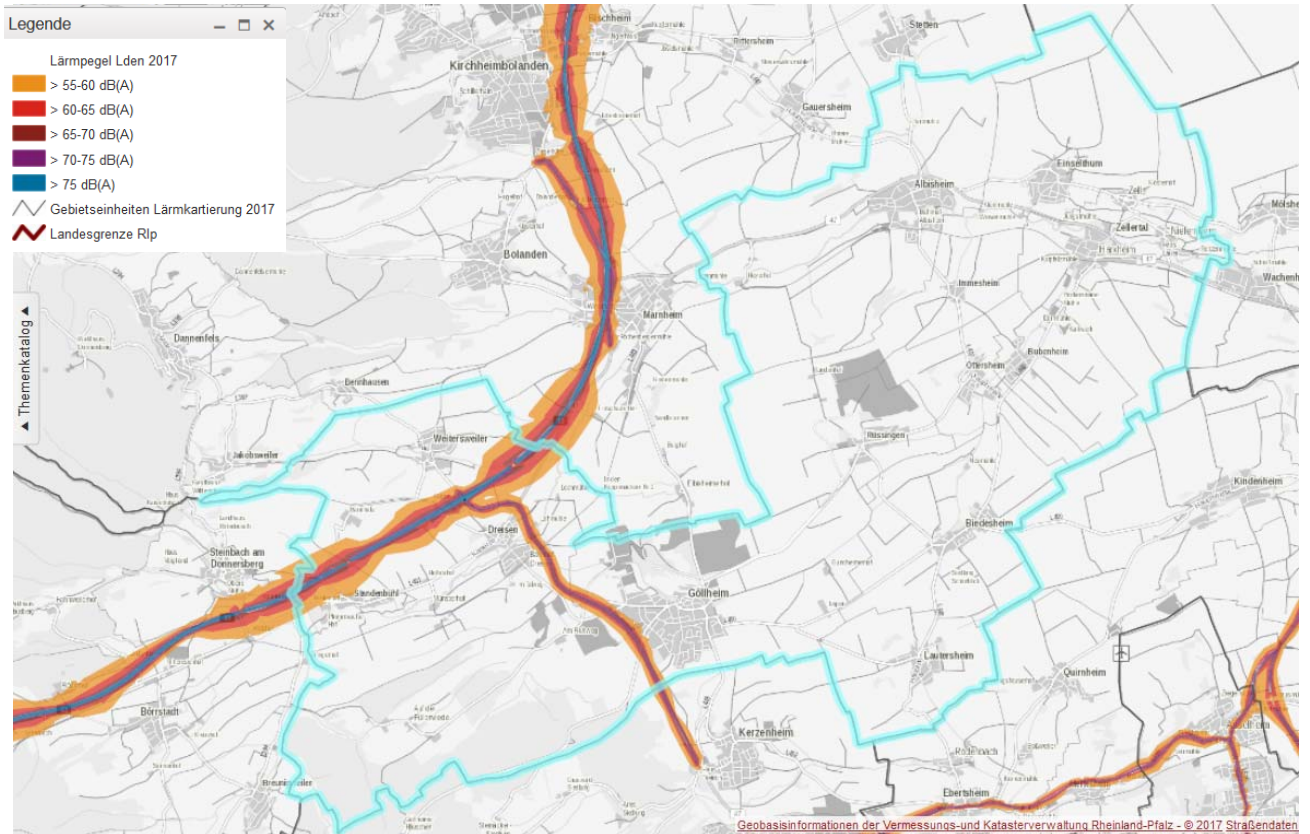
Abbildung 1 Verkehrslärmbelastung Verbandsgemeinde Göllheim, Lärmindex L_{DEN}

Aus der Tabelle 2 ist die Zahl betroffener Einwohner, aus der Tabelle 3 ist die Zahl der betroffenen Wohnungen, Schulen sowie der belasteten Fläche ersichtlich; Krankenhäuser gibt es in der VG nicht. Die Abbildungen 1 und 2 (Isolinienkarten) spiegeln die Belastung durch Straßenverkehrslärm in der Verbandsgemeinde Göllheim für die Lärmindizes L_{DEN} 7 bzw. L_{Night} 8 wider.