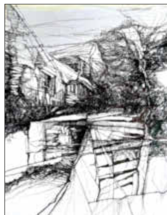
Jörg Kuplens: ländliche Begegnung