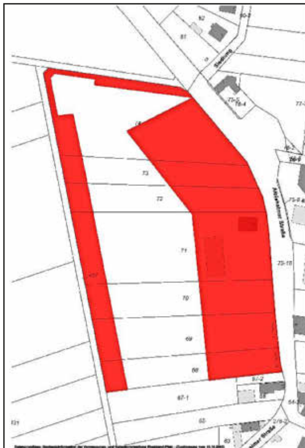
Geltungsbereich des Bebauungsplanentwurfes „Grabenäcker, Änderung und Erweiterung I“ der Ortsgemeinde Immesheim