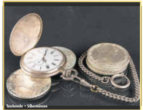
Taschenuhr • Silbermünzen

»Wecker« aus dem Tresor zu holen und diese den Experten vorzulegen. Laut Experten kann beispielsweise eine Rolex GMT Master aus den 70er-Jahren bis zu 9.000 EUR erzielen. Des Weiteren bieten die Experten von »Bares für Wa(h)res« kostenlose Wertschätzung von Diamanten an. Besonders interessant sind Diamanten im Brillant-Schliff ab einer Größe von 0,50 Karat. Hier gilt immer die Faustregel: Ein einzelner großer Diamant ist wertvoller als viele kleine Diamanten. Ein Besuch bei den Experten lohnt sich in jedem Fall, denn hier wird Ihr Schatz professionell taxiert und zu einem fairen Preis entgegengenommen.