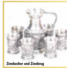
Zinnbecher und Zinnkrug