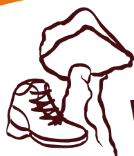
Anablick Geiersteine-Tour

Tourist-Info-Zentrum Pfälzerwald Schuhmeile 1 · 76846 Hauenstein · Tel. 06392 9233380 www.urlaubsregion-hauenstein.de