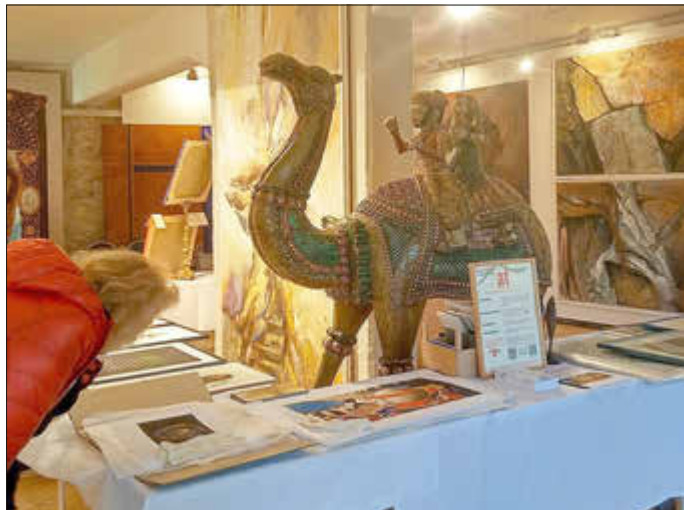
Minikunstmesse in Niefernheim