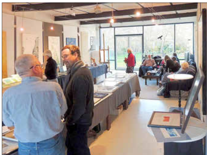
Minikunstmesse in Niefernheim