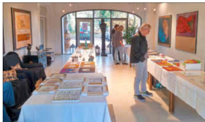
Mini-Kunst-Messe im Atelier Borries, Niefernheim

Ort des Geschehens: Atelier Borries, Brückenstr.4 in Zellertal-Niefernheim