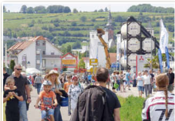
Zahlreiche Messebesucher in der Obersülzer Straße