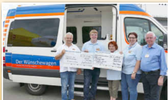
Fröhliche Gesichter beim Team des ASB-Wünschewagens