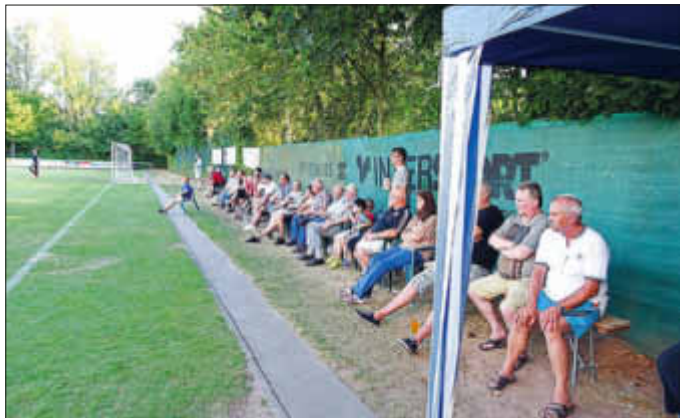
Viele Zuschauer verfolgten 2018 die Spiele

Die TSG hofft bei all diesen Veranstaltungen auf regen Zuspruch innerhalb der Bevölkerung und der Fangruppen der Gastmannschaften und wünscht schon jetzt gute Unterhaltung und einen angenehmen Aufenthalt im Albisheimer Primmstadion.