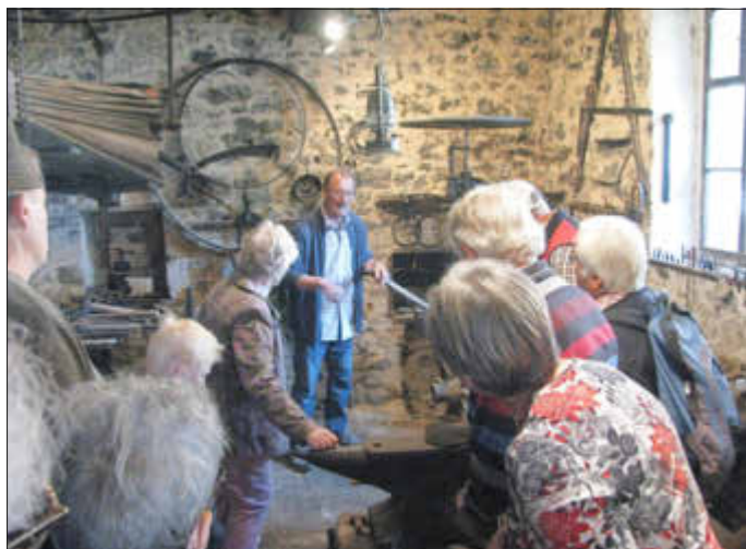
Vorführung in der alten Dorfschmiede

Auch in diesem Jahr ist die historische Dorfschmiede geöffnet. Sie wurde 1750 erbaut und ist im Originalzustand von 1959 erhalten. Außerdem öffnet die Kirche mit ihrem spätgotischen Marien-Flügelaltar ihre Pforten. Die Veranstaltung beginnt um 11 Uhr. Parkmöglichkeiten sind ausreichend vorhanden, der Rundweg ist ausgeschildert. Weitere Infos unter www.zellertal-aktiv.de