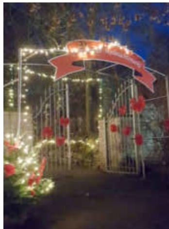
Eingang zum Pfarrgarten

Immer am ersten Adventswochenende öffnen sich im Albisheimer Pfarrgarten die Tore zum Weihnachtsmarkt der Gewerbegemeinschaft Albisheim. Auch in diesem Jahr warten am 30. November und 1. Dezember viele Stände unter den leuchtend geschmückten Bäumen auf Besucher. Geboten wird, was das Herz begehrt: Neben Tiffany Glaskunst im Jugendstil gibt es weihnachtliche Deko, Gebäck, Gestecke und Kränze.