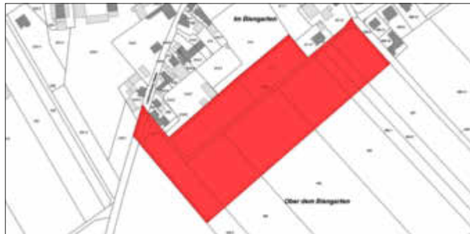
Lageplan des räumlichen Geltungsbereichs dieser Satzung

Die Begrenzung des räumlichen Geltungsbereichs ist in dem nachstehenden Lageplan hervorgehoben. Der Lageplan ist Bestandteil dieser Satzung.