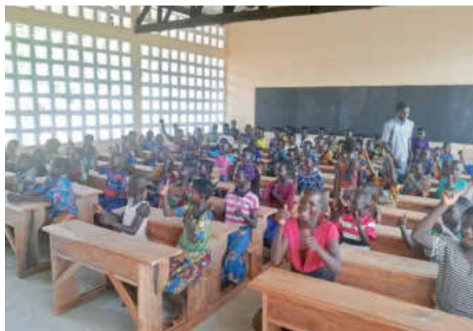
Schule und Klassenzimmer nach Fertigstellung Oktober 2021