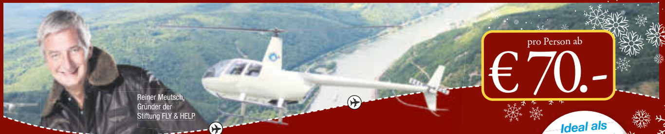
Reiner Meutsch, Gründer der Stiftung FLY & HELP