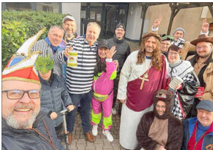
Elferrat am Fastnachts-Dienstag