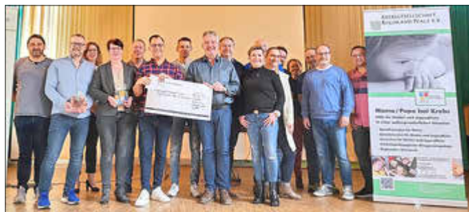
Elferrat bei der Spendenübergabe