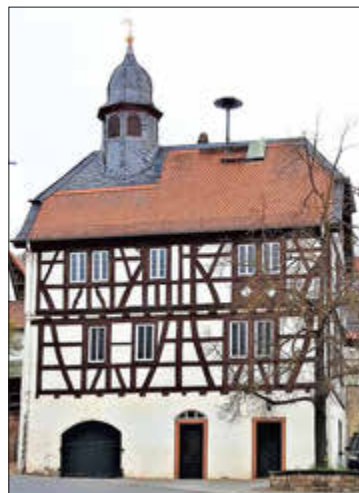
Rathaus mit Betsaal

Anlässlich des Jubiläums der katholischen Kirchengemeinde Dreisen, findet am 02.06.2024 um 10 Uhr eine heilige Messe unter Mitwirkung des Gesangvereins Dreisen, statt. Hierzu, sowie zu einem kleinen Umtrunk mit musikalischer Unterstützung durch den Musik Club Fidelio Dreisen im Anschluss, sind Sie alle rechtherzlich zum Rathaus/Betsaal eingeladen.