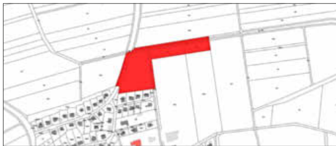
Bebauungsplan „Neun Morgen“ der Ortsgemeinde Weitersweiler