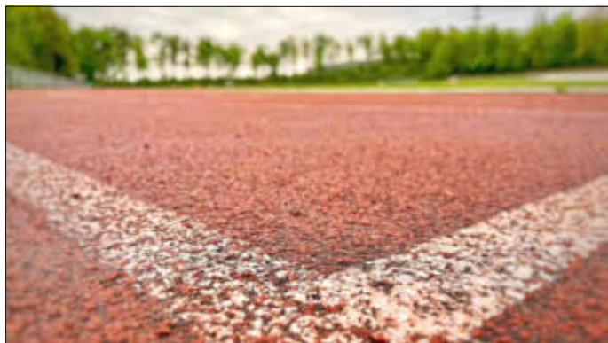
Beim Tag des Donnersberger Sports in Göllheim gibt es am 4. Juni zahlreiche Angebote.

Immer wieder aktualisierte Informationen zum Tag des Donnersberger Sports erhalten Sie unter www.sport.donnnersberg.de