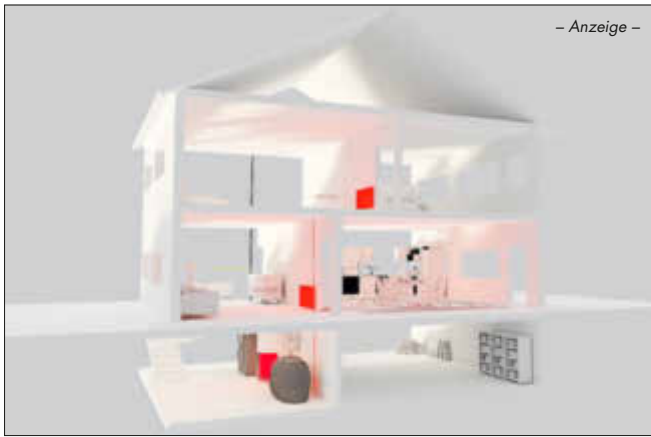
- Anzeige -