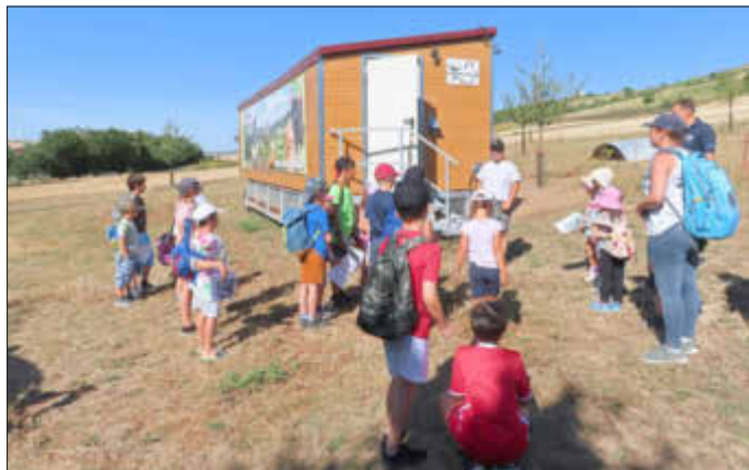
Besuch beim Hühnermobil

Nichts ahnend legten die knapp 30 Teilnehmer entschlossen los und wanderten zum Albisheimer Warteturm. Auf dem Weg dahin gab es eine kleine Station am Hühnermobil der Familie Enders. Mit Begeisterung hörten die kleinen Wanderer der jungen Frau Enders zu – sie hat nämlich ganz spontan einen Hühner- und Eiervortrag gehalten. Die Wandergruppe durfte sogar in das moderne Hühnermobil reinschauen. Für die anwesenden Kinder war das sehr spannend. Mit einer Kurbel holten einige Freiwillige die Eier aus dem Hühnermobil fast direkt in die Eierschachtel! Vielen Dank an Familie Enders für diese wunderbaren Einblicke!