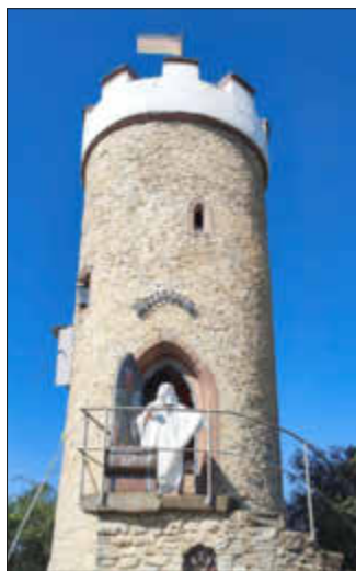
Der Geist des Warteturms