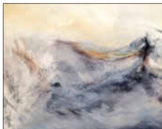
Gemälde von Björn Ruppert

In seinen Gemälden verbinden sich abstrakte Landschaften mit geometrischen Elementen, die an Architektur denken lassen. Mit vielschichtigem Auftrag der Ölfarbe sucht der Maler immer wieder abstrakte Strukturen, die das Auge des Betrachters provozieren, Landschaft darin sehen zu wollen. Ob es sich dabei beispielsweise um Berg- oder Wellenkämme handelt, bleibt offen. Es geht ausschließlich um Phantasien des Künstlers, seine sehr malerischen Strukturen erinnern an Landschaft, wollen aber keinesfalls konkrete Abbildung sein. Beim Betrachten stoßen wir