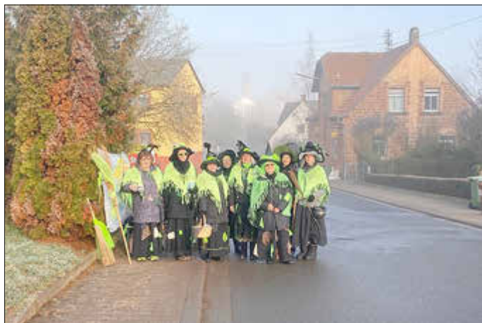
Die Weitschwiller Dunnerhexe im Einsatz.