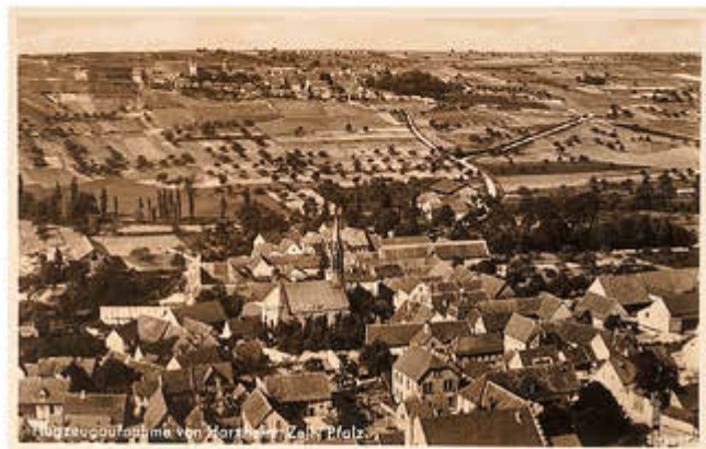
Flugzeugaufnahme vom Zeller Berg aus den 30er Jahren. Die Weinberge am Hang waren damals noch mit mehr Bäumen (z.B. Mandeln) durchsetzt.