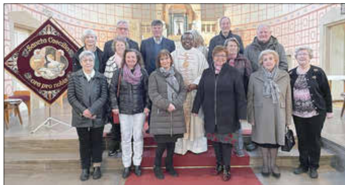
Der Kath. Kirchenchor St. Cäcilia in Ramsen freut sich über neue Sängern und Sängerinnen