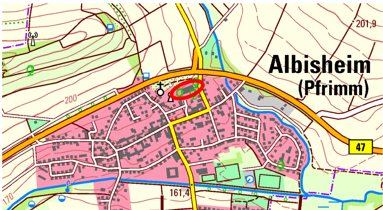
Abbildung 1: Lage des Plangebietes im Ortsgefüge (ohne Maßstab) 1

Der Geltungsbereich des Bebauungsplanes „Ortsmitte“ umfasst vollständig das Flurstück 305/10 und teilweise das Flurstück 305/23.