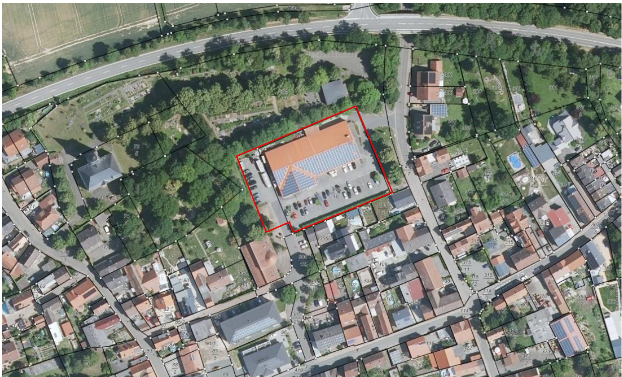
Abbildung 2: Lage des Plangebietes innerhalb der Bebauungsstruktur (ohne Maßstab) 2